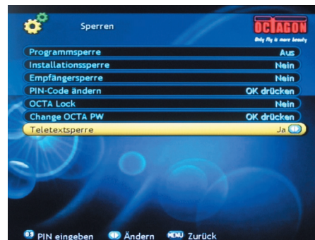
Innovativ: Der Octagon-Receiver kann Teletext-Seiten sperren

einer Sekunde erfreulich schnell möglich. Im EPG-Modus ist weiterhin das aktuelle Live-Bild zu sehen, Wert legt der elektronische Programmführer vor allem auf die Inhaltsangabe zur aktuellen Sendung. Durch die große Schrift werden die Bezeichnungen der folgenden Sendungen leider teilweise abgeschnitten.