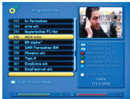
Übersichtlich: Bei der Navigation durch den elektronischen Programmführer bleibt das Live-Signal im Bild